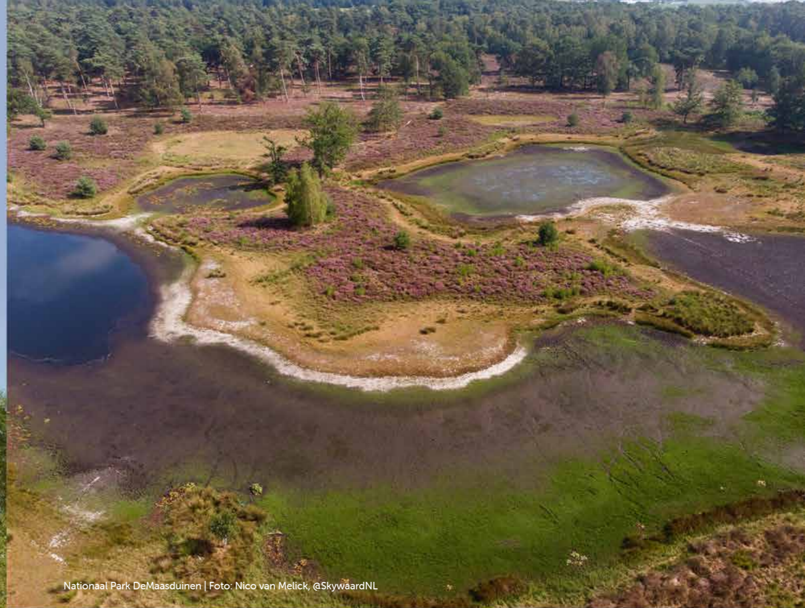
Nationaal Park DeMaasduinen | Foto: Nico van Melick, @SkywaardNL