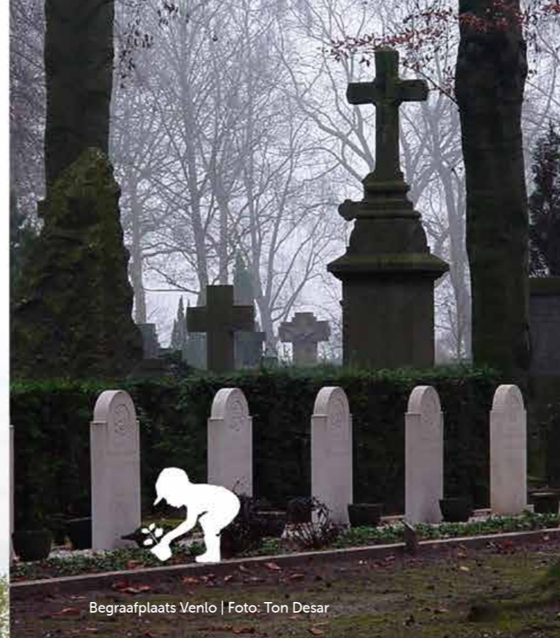
Begraafplaats Venlo