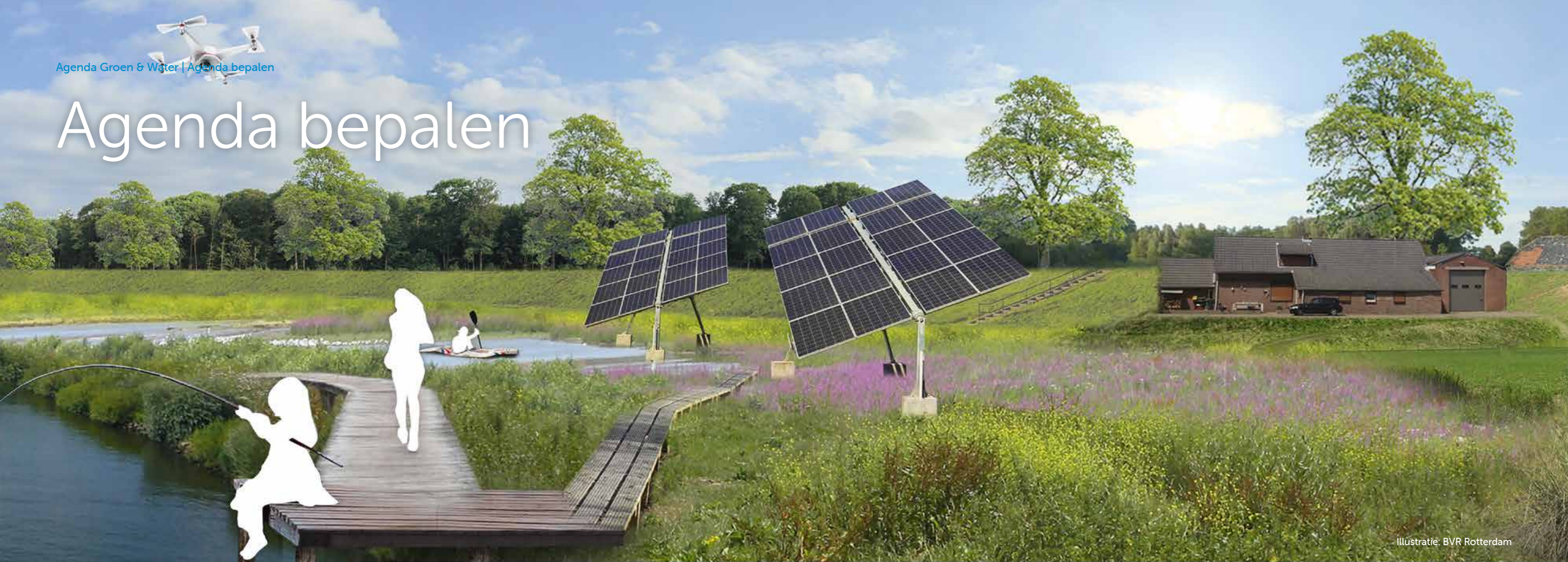
Illustratie: BVR Rotterdam