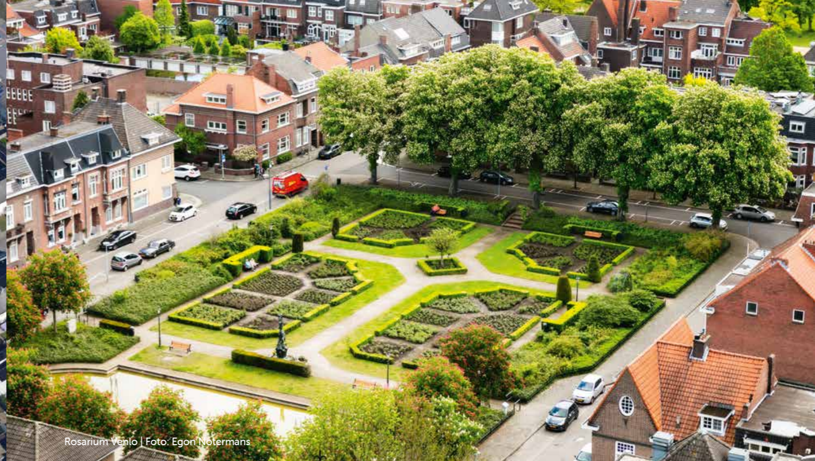
Rosarium Venlo