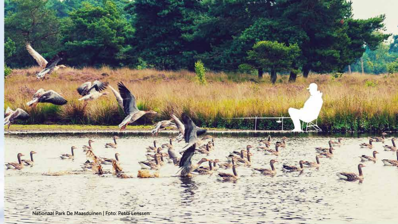
Nationaal Park De Maasduinen