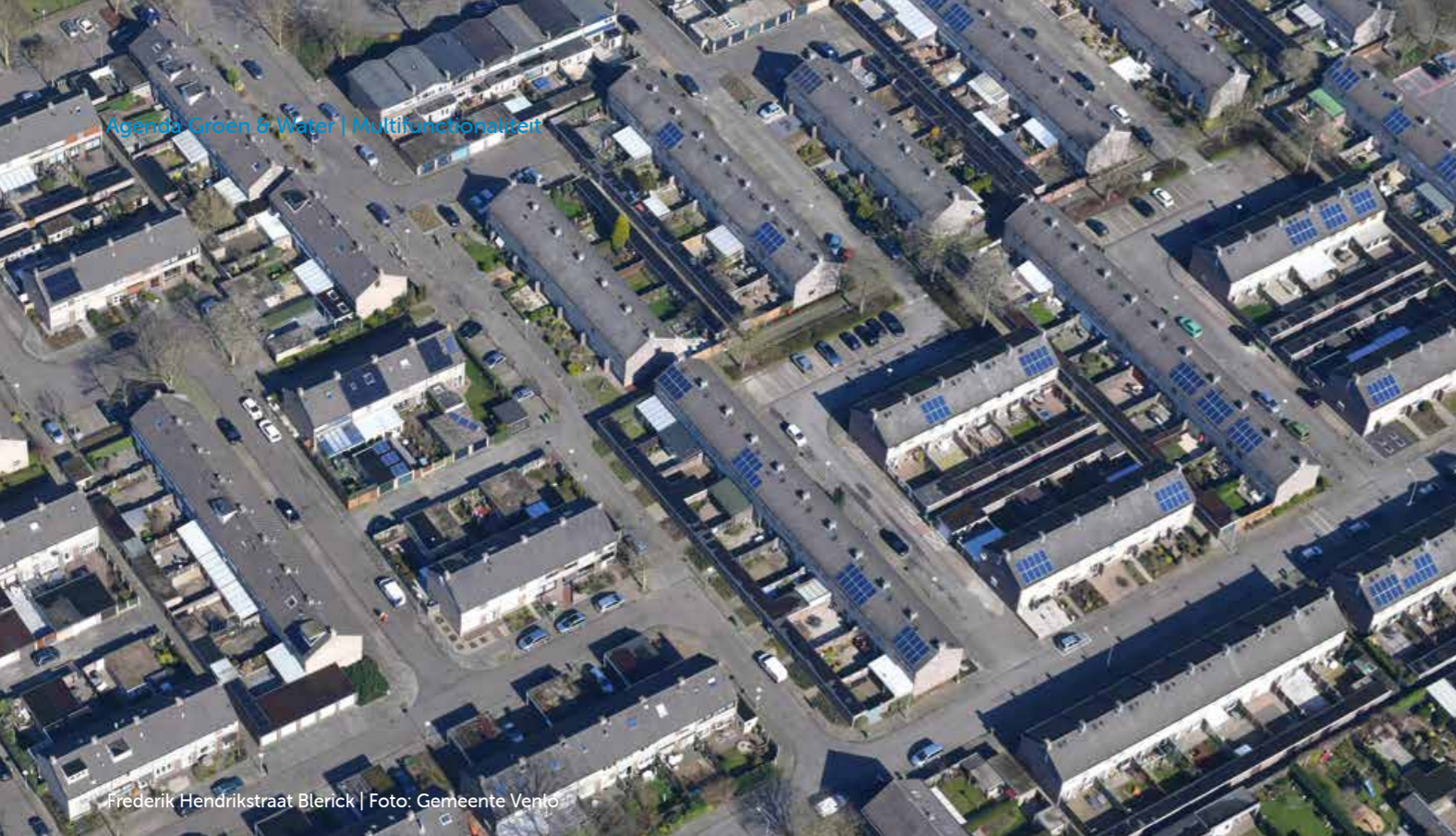
Frederik Hendrikstraat Blerick | Foto: Gemeente Venlo