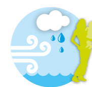
Stad van de toekomst