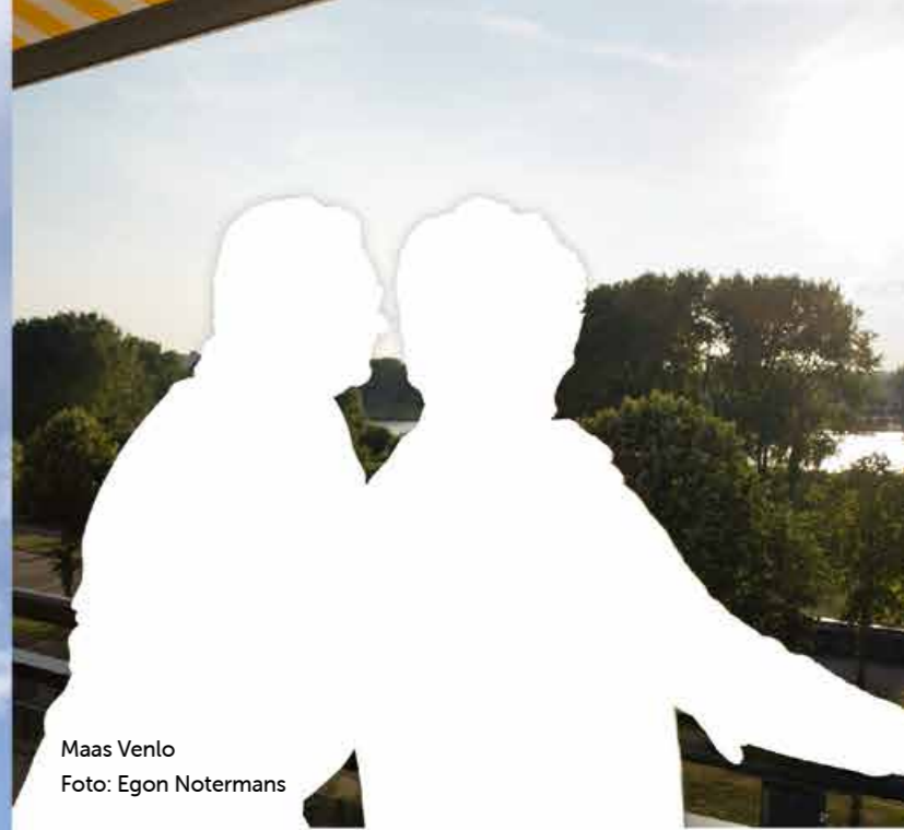
Maas Venlo