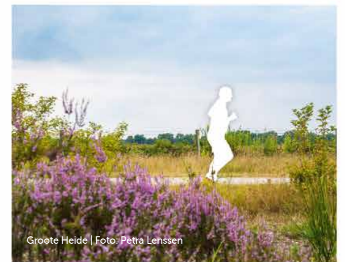
Groote Heide