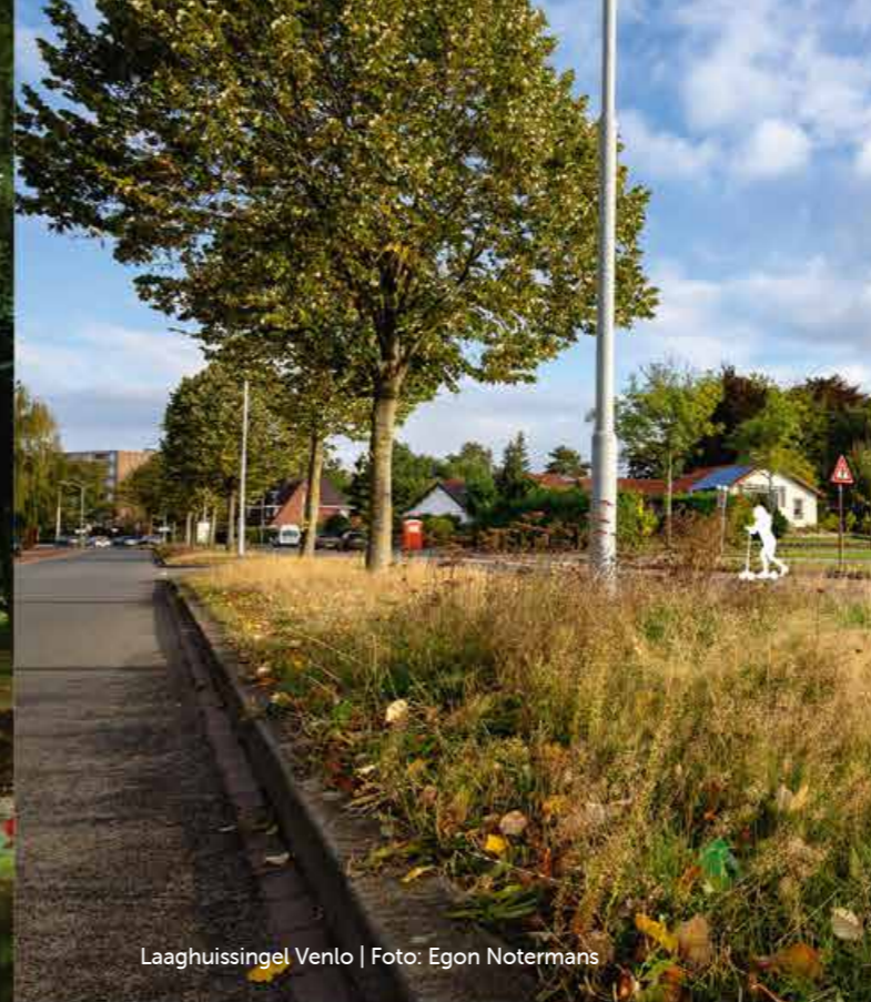
Laaghuissingel Venlo