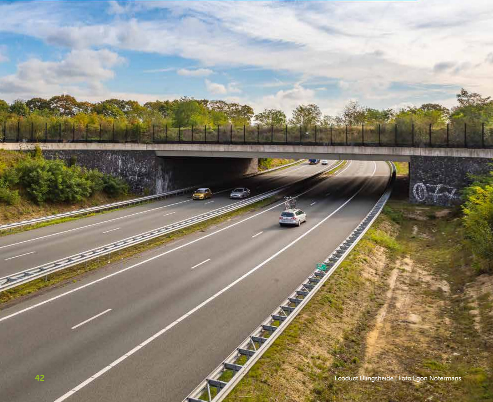
Ecoduct Ulingsheide

In ons dagelijks leven beseffen we nog nauwelijks dat wij afhankelijk zijn van de natuur. Maar zonder gezonde natuur van enige omvang kan de mens niet bestaan. Tegelijkertijd is de natuur in onze omgeving steeds meer afhankelijk van de mens. Hoe kunnen wij in Venlo er samen voor zorgen dat dit bondgenootschap voor volgende generaties goed functioneert?