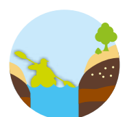
Het Venlose landschap vertelt...