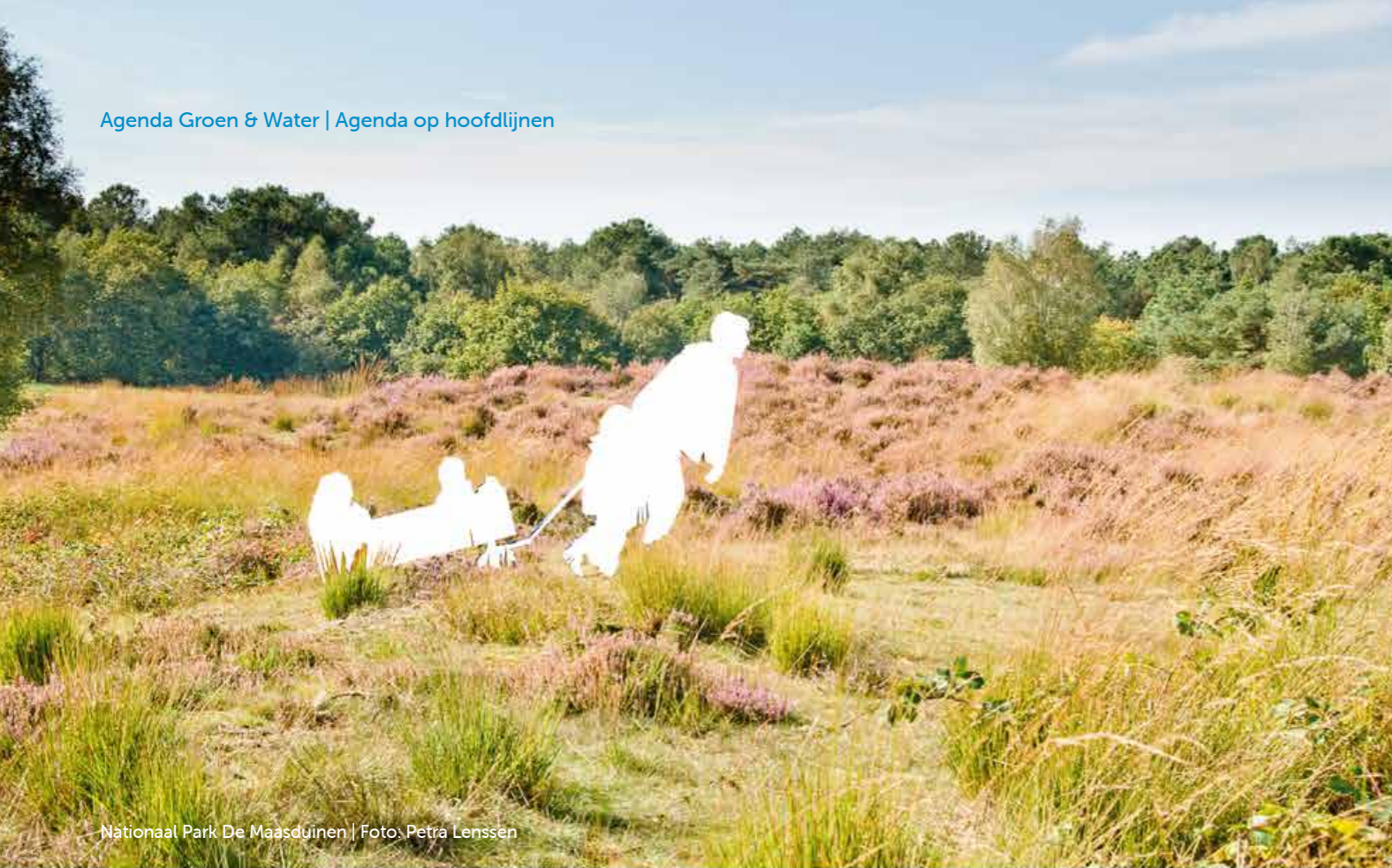
Nationaal Park De Maasduinen