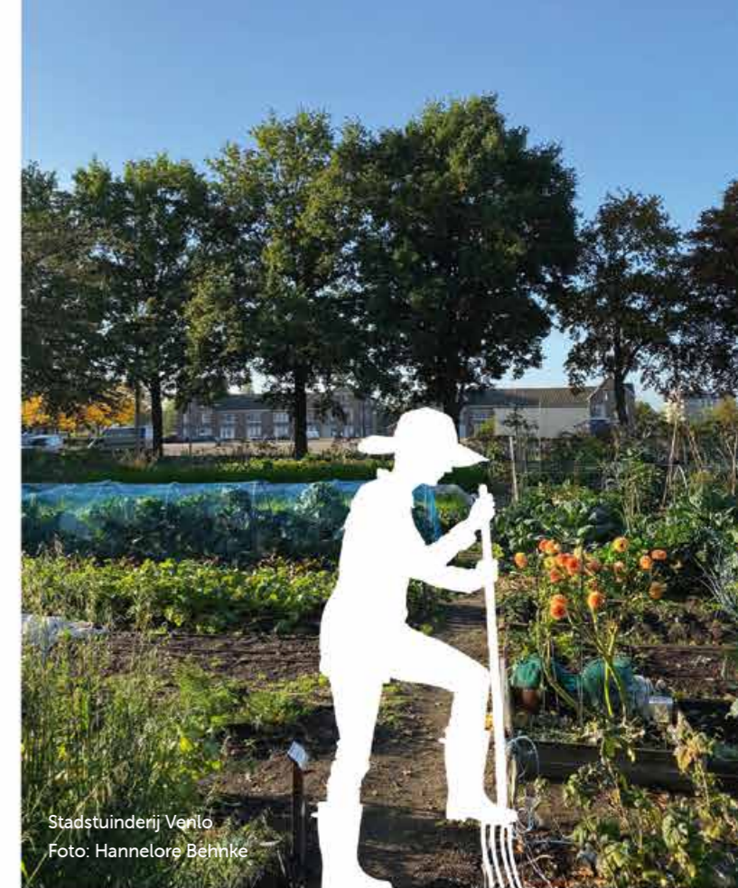
Stadstuinderij Venlo

...het verhaal van de mens en andersom. De aantrekkelijkheid van het landschap is belangrijk voor een prettige leefomgeving, zodat mensen zich verbonden voelen. We willen de eigenheid van Venlo met onze Maas-identiteit behouden en versterken. We koesteren de identiteit van het Venlose landschap . We laten het landschap zijn verhaal vertellen: maken het zichtbaar en leesbaar, delen de kennis. De kernwaarden benoemen we in een landschapsvisie waarin we kiezen wat belangrijk is. We zetten in op verfraaiing van het landschap door voorlichting en stimulering met subsidiemogelijkheden voor groenblauwe diensten en erfbeplantingsacties.