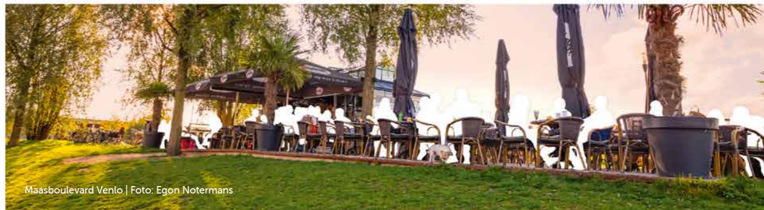
Maasboulevard Venlo | Foto: Egon Notermans

Voor Maas-recreatie, Nationaal Park De Maasduinen en verbindingen maken we optimaal gebruik van de creativiteit van de burger door uitnodigend en wervend te zijn voor initiatieven. Daarvoor maken we gebruik van onze netwerken. We liften mee met investeringen van derden en eenmalige kansen. We zijn een goede partner: we faciliteren én pakken onze rol: initiatief nemen, marketing, verleiden en verbinden, netwerken, samenwerken, en waar nodig financieel bijdragen. Dit brengen we in via de begrotingscyclus.