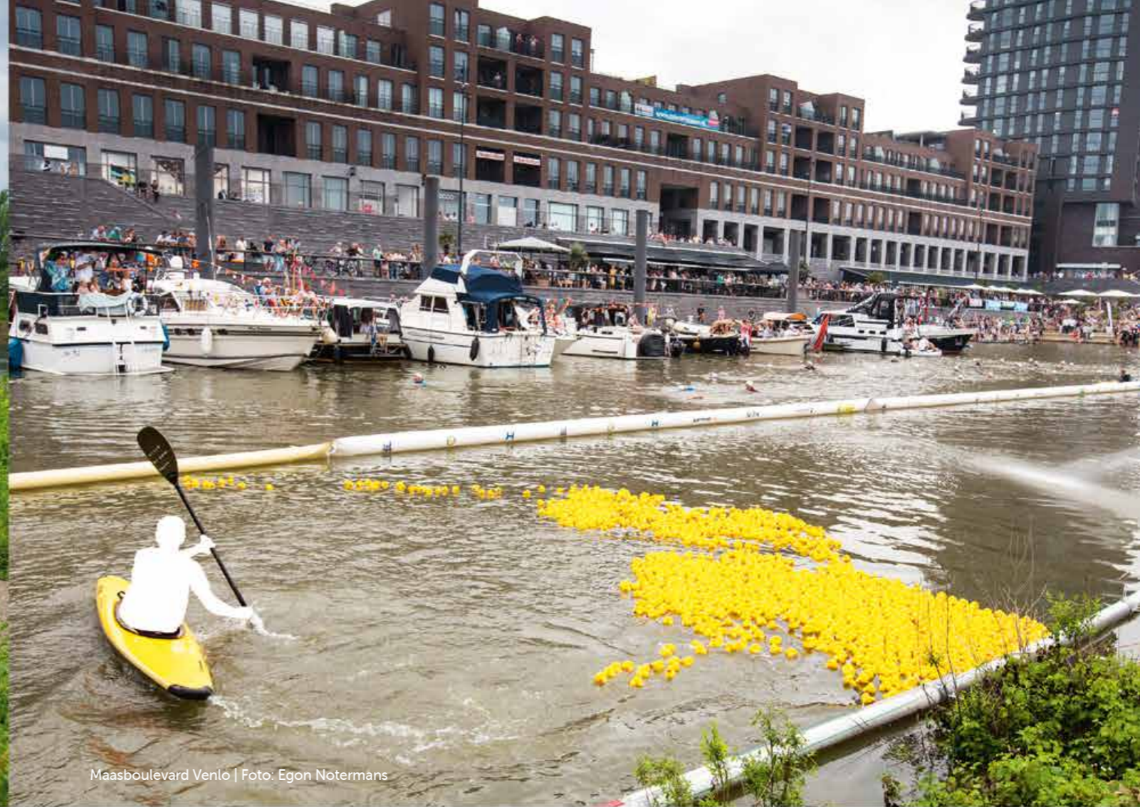
Maasboulevard Venlo