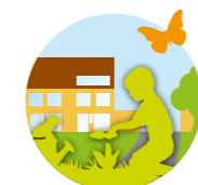
Kracht van Groen & Gezond in de wijk