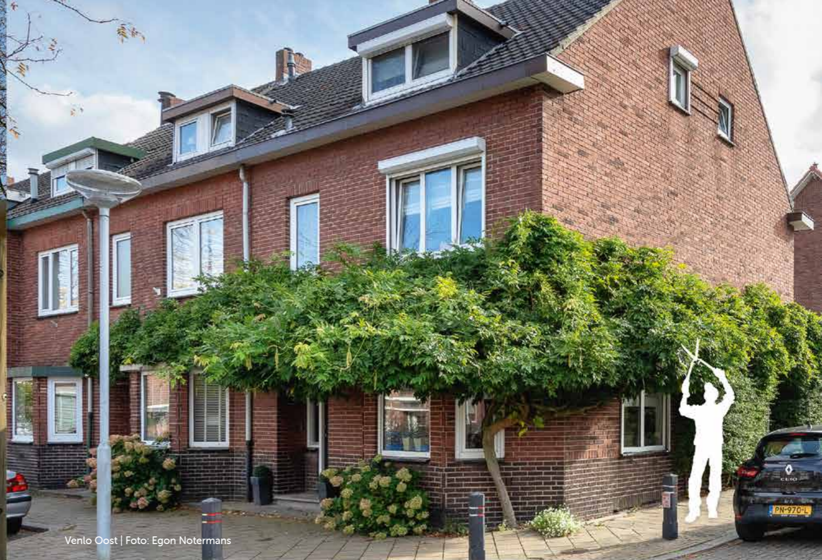
Venlo Oost | Foto: Egon Notermans