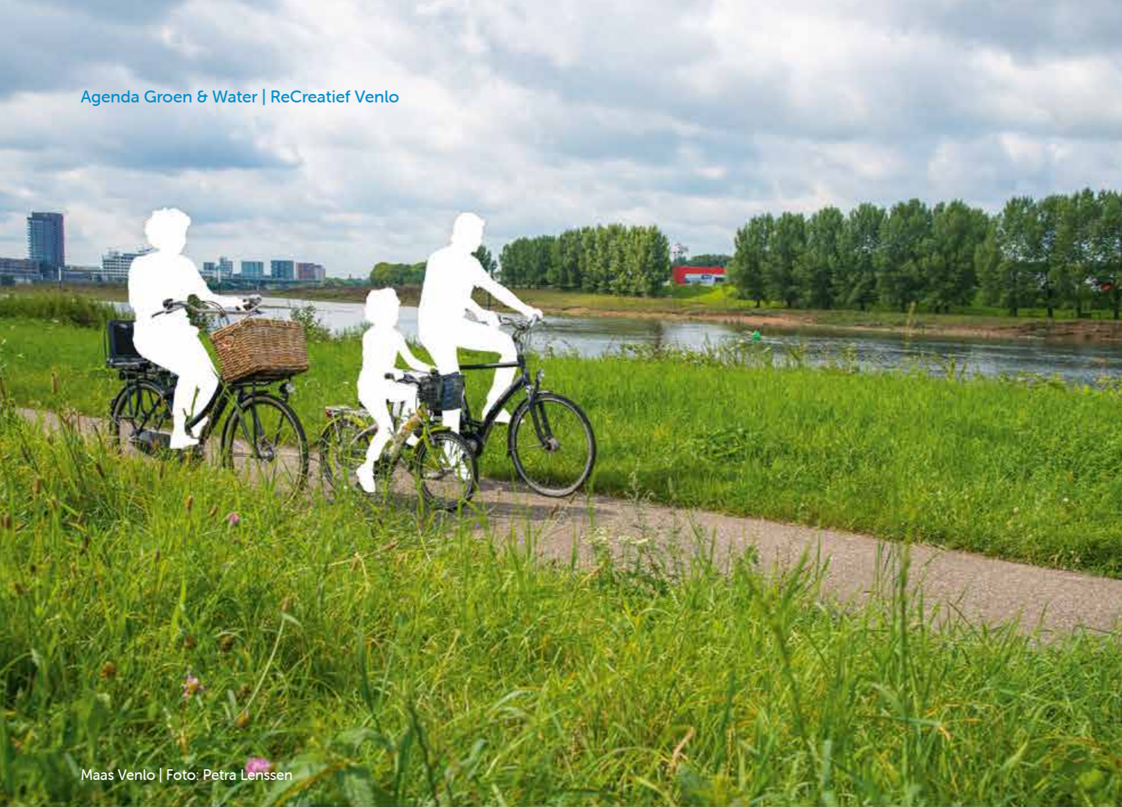
Maas Venlo