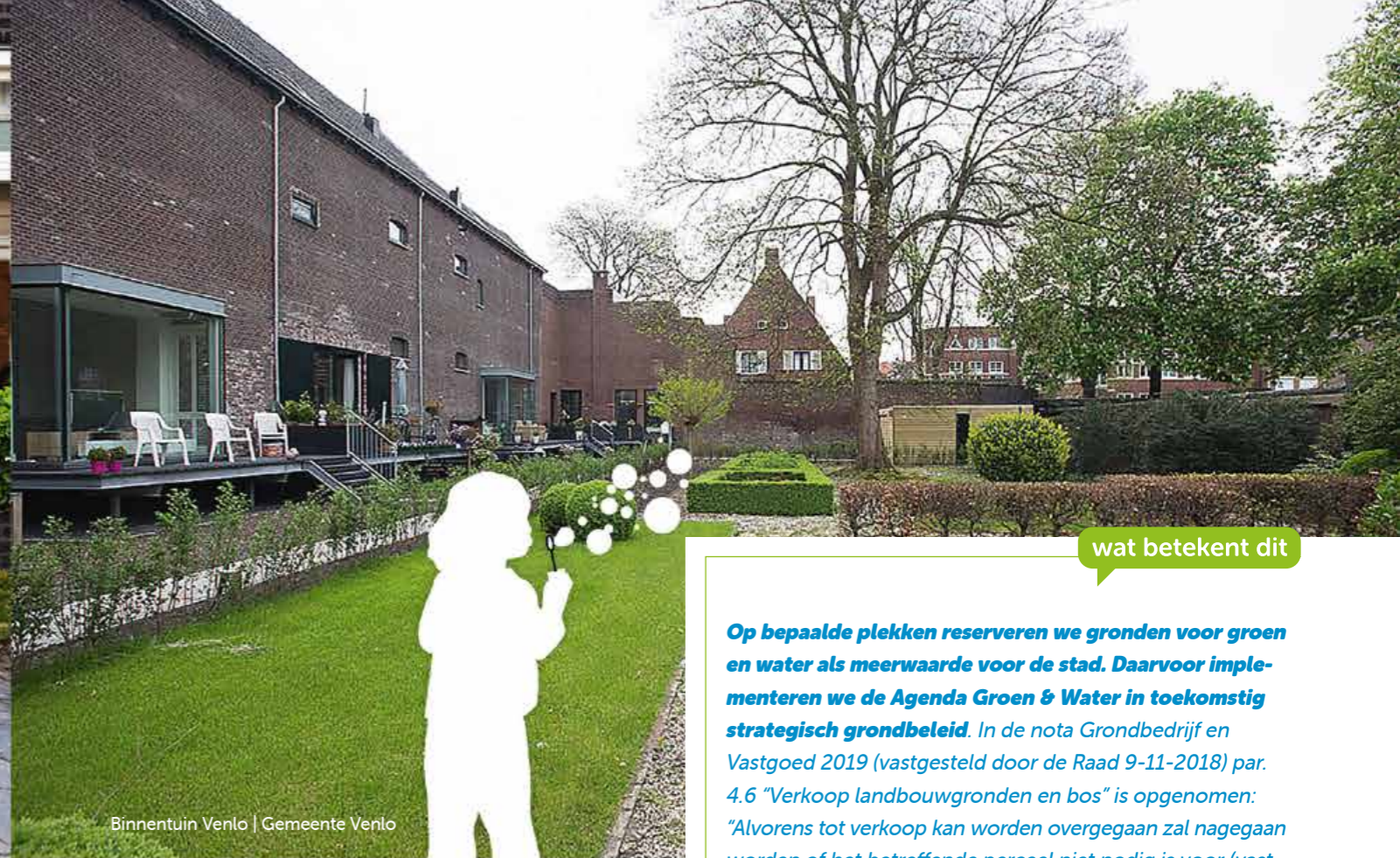
Binnentuin Venlo | Gemeente Venlo