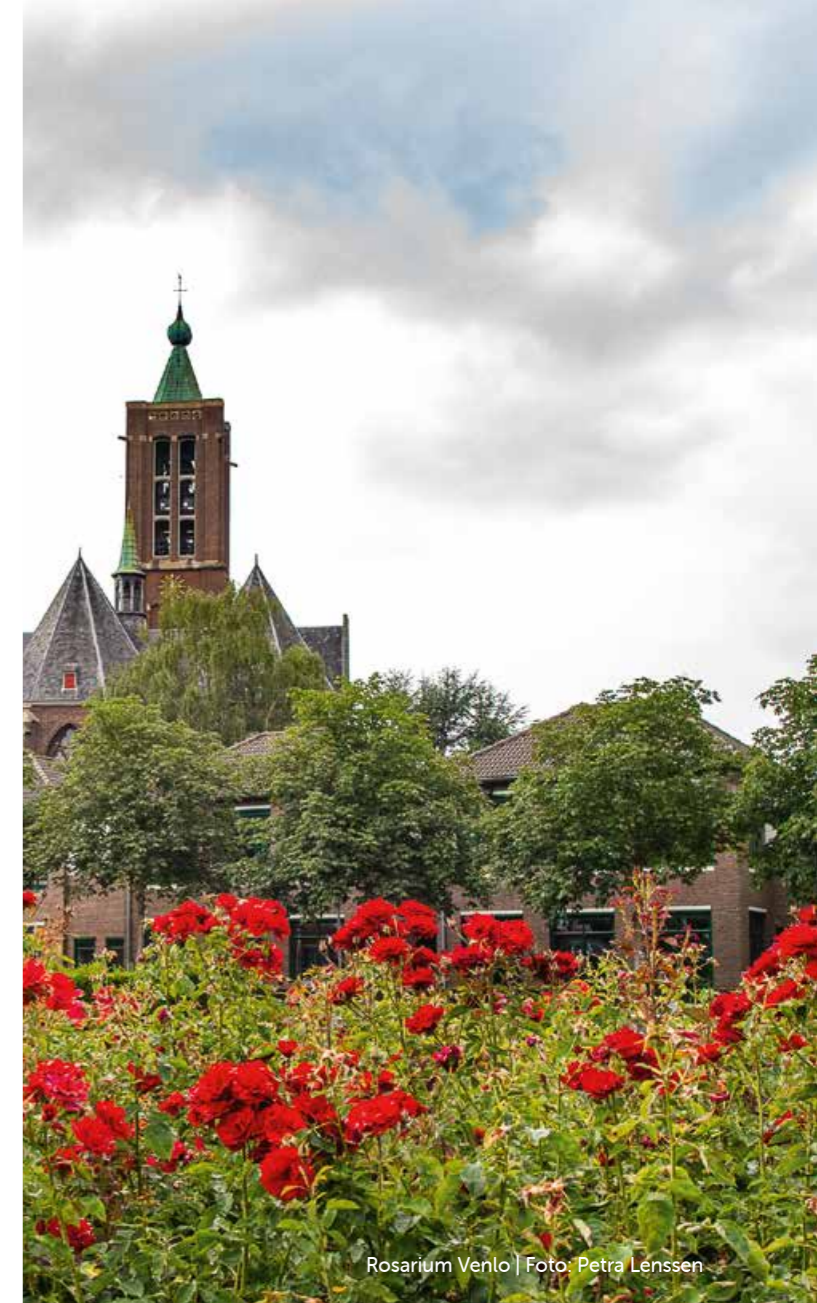
Rosarium Venlo | Foto: Petra Lenssen

Juist omdat we de effecten van de klimaatverandering niet allemaal in de openbare ruimte op kunnen vangen en gezamenlijk moeten veranderen om dit probleem aan te kunnen, laten we ons inspireren door en helpen we partners en inwoners om klimaatproof te worden. Als gemeente geven wij het goede voorbeeld door klimaatadaptief bouwen, inrichten en beheren.