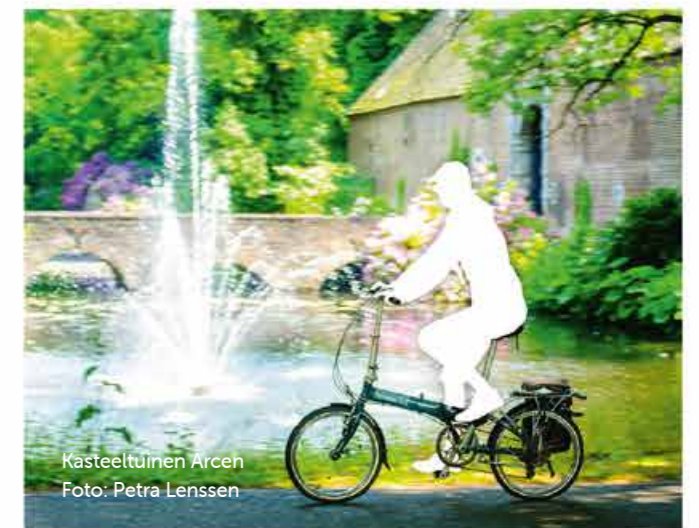
Kasteeltuinen Arcen

We creëren subsidiemogelijkheden voor initiatiefnemers voor bijvoorbeeld groenblauwe diensten en erfbeplantingsacties.