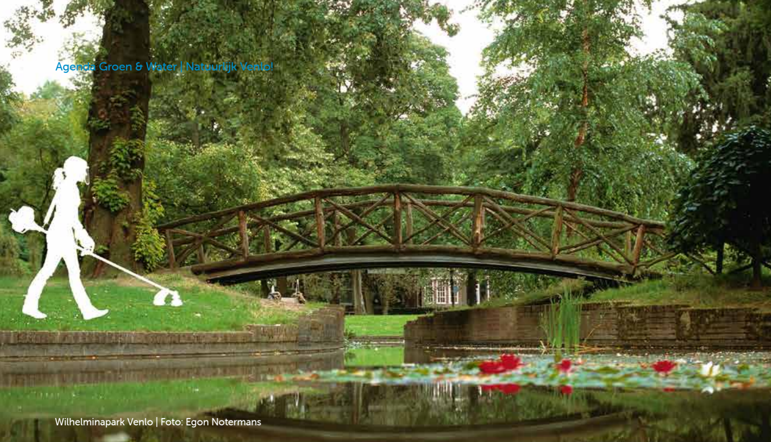
Wilhelminapark Venlo | Foto: Egon Notermans