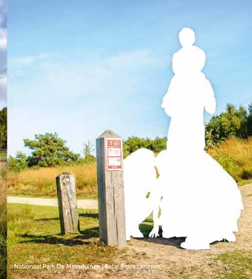
Nationaal Park De Maasduinen